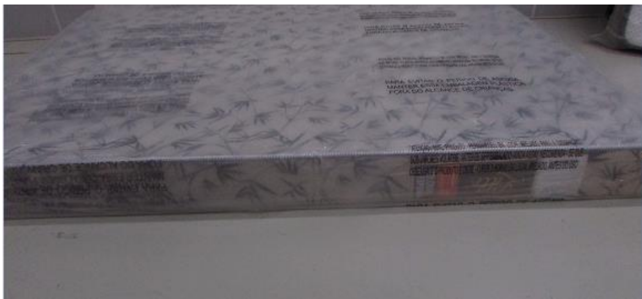
FOTO 3: LOCAL DE FIXAÇÃO DA ETIQUETA NA AMOSTRA RECEBIDA PARA ENSAIO

Os resultados apresentados no presente documento referem-se exclusivamente a(s) amostra(s) ensaiada(s). A reprodução deste documento somente poderá ser feita na íntegra e sua utilização para fins promocionais depende de autorização prévia.