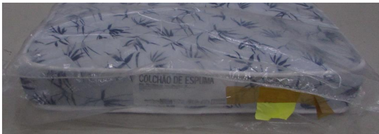
FOTO 3: LOCAL DE FIXAÇÃO DA ETIQUETA NA AMOSTRA RECEBIDA PARA ENSAIO

Os resultados apresentados no presente documento referem-se exclusivamente a(s) amostra(s) ensaiada(s). A reprodução deste documento somente poderá ser feita na íntegra e sua utilização para fins promocionais depende de autorização prévia.