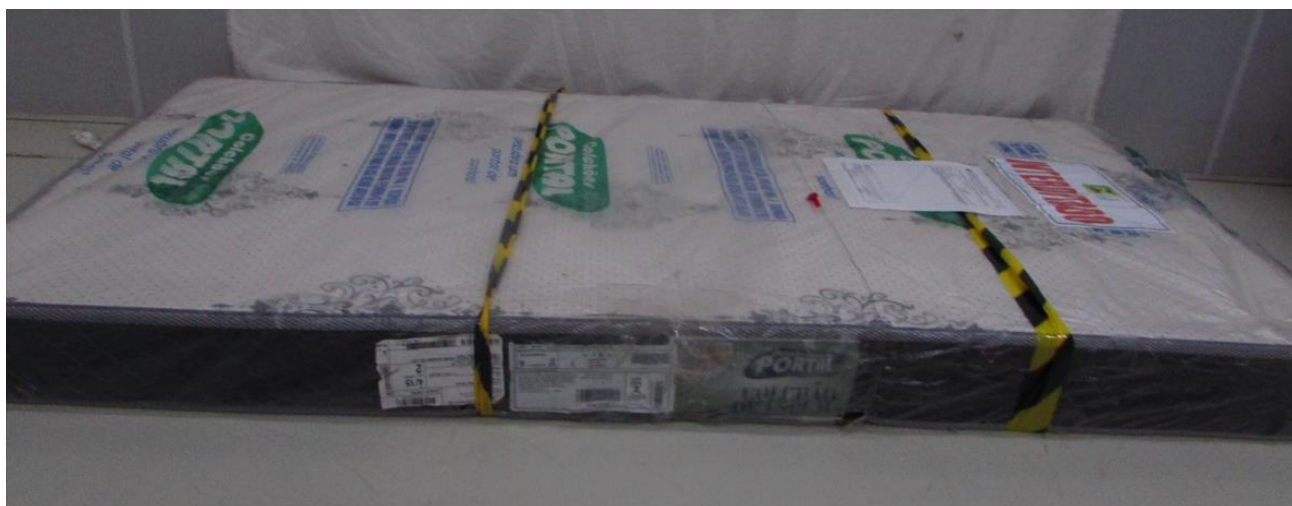
FOTO 3: LOCAL DE FIXAÇÃO DA ETIQUETA NA AMOSTRA RECEBIDA PARA ENSAIO

Os resultados apresentados no presente documento referem-se exclusivamente a(s) amostra(s) ensaiada(s). A reprodução deste documento somente poderá ser feita na íntegra e sua utilização para fins promocionais depende de autorização prévia.