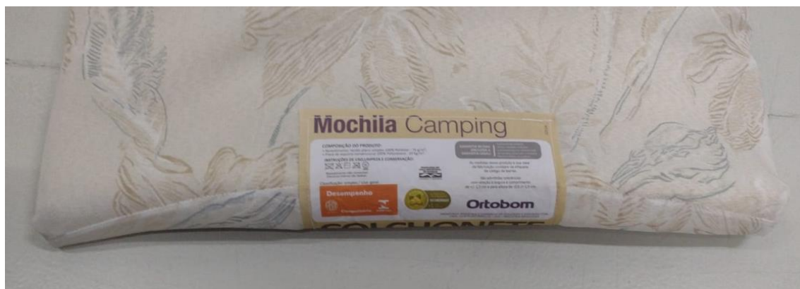
FOTO 3: LOCAL DE FIXAÇÃO DA ETIQUETA NA AMOSTRA RECEBIDA PARA ENSAIO

Os resultados apresentados no presente documento referem-se exclusivamente a(s) amostra(s) ensaiada(s). A reprodução deste documento somente poderá ser feita na íntegra e sua utilização para fins promocionais depende de autorização prévia.