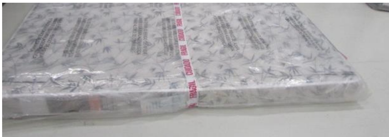
FOTO 3: LOCAL DE FIXAÇÃO DA ETIQUETA NA AMOSTRA RECEBIDA PARA ENSAIO

Os resultados apresentados no presente documento referem-se exclusivamente a(s) amostra(s) ensaiada(s). A reprodução deste documento somente poderá ser feita na íntegra e sua utilização para fins promocionais depende de autorização prévia.