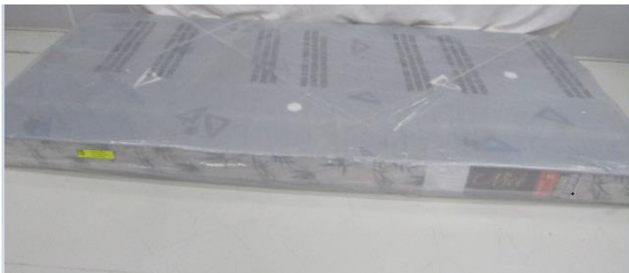
FOTO 3: LOCAL DE FIXAÇÃO DA ETIQUETA NA AMOSTRA RECEBIDA PARA ENSAIO

Os resultados apresentados no presente documento referem-se exclusivamente a(s) amostra(s) ensaiada(s). A reprodução deste documento somente poderá ser feita na íntegra e sua utilização para fins promocionais depende de autorização prévia.