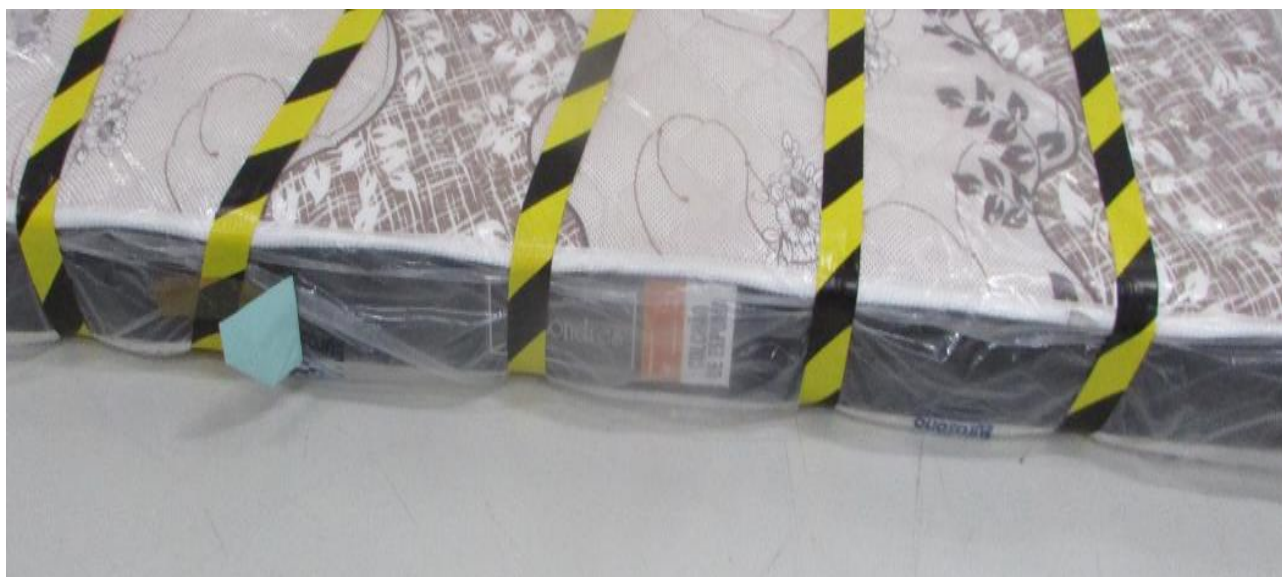
FOTO 3: LOCAL DE FIXAÇÃO DA ETIQUETA NA AMOSTRA RECEBIDA PARA ENSAIO

Os resultados apresentados no presente documento referem-se exclusivamente a(s) amostra(s) ensaiada(s). A reprodução deste documento somente poderá ser feita na íntegra e sua utilização para fins promocionais depende de autorização prévia.