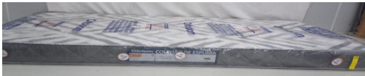
FOTO 3: LOCAL DE FIXAÇÃO DA ETIQUETA NA AMOSTRA RECEBIDA PARA ENSAIO

Os resultados apresentados no presente documento referem-se exclusivamente a(s) amostra(s) ensaiada(s). A reprodução deste documento somente poderá ser feita na íntegra e sua utilização para fins promocionais depende de autorização prévia.