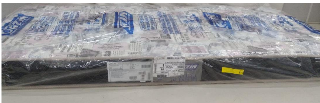
FOTO 3: LOCAL DE FIXAÇÃO DA ETIQUETA NA AMOSTRA RECEBIDA PARA ENSAIO

Os resultados apresentados no presente documento referem-se exclusivamente a(s) amostra(s) ensaiada(s). A reprodução deste documento somente poderá ser feita na íntegra e sua utilização para fins promocionais depende de autorização prévia.