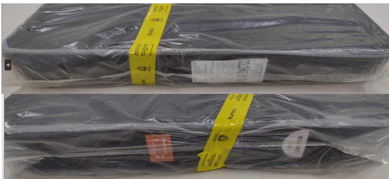
FOTO 3: LOCAL DE FIXAÇÃO DA ETIQUETA NA AMOSTRA RECEBIDA PARA ENSAIO

Os resultados apresentados no presente documento referem-se exclusivamente a(s) amostra(s) ensaiada(s). A reprodução deste documento somente poderá ser feita na íntegra e sua utilização para fins promocionais depende de autorização prévia.