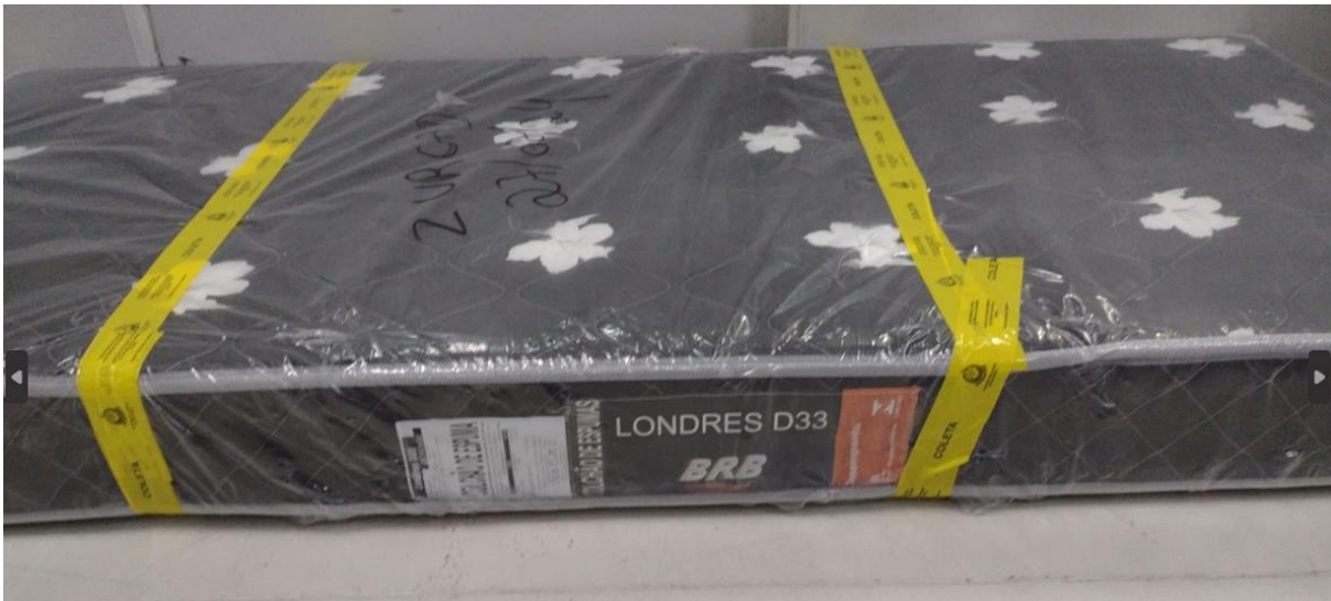
FOTO 3: LOCAL DE FIXAÇÃO DA ETIQUETA NA AMOSTRA RECEBIDA PARA ENSAIO