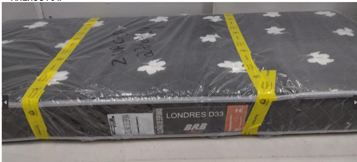
FOTO 3: LOCAL DE FIXAÇÃO DA ETIQUETA NA AMOSTRA RECEBIDA PARA ENSAIO