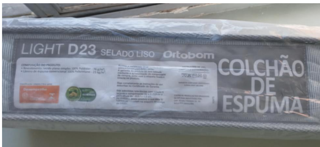
FOTO 3: LOCAL DE FIXAÇÃO DA ETIQUETA NA AMOSTRA RECEBIDA PARA ENSAIO