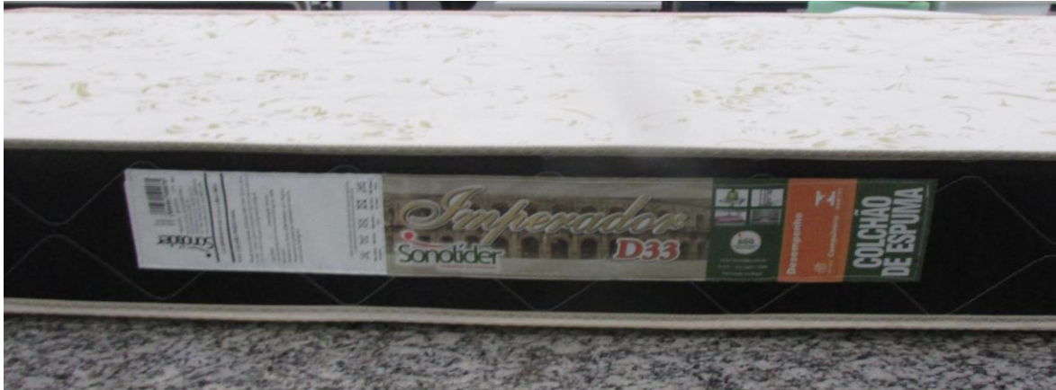
FOTO 7: LOCAL DE FIXAÇÃO DA ETIQUETA NA AMOSTRA RECEBIDA PARA ENSAIO

Laboratório de Ensaio Acreditado pela Cgcre de acordo com a ABNT NBR ISO/IEC 17025, sob o nº CRL-1307 A Cgcre é signatária do Acordo de Reconhecimento Mútuo da ILAC – International Laboratory Accreditation Cooperation