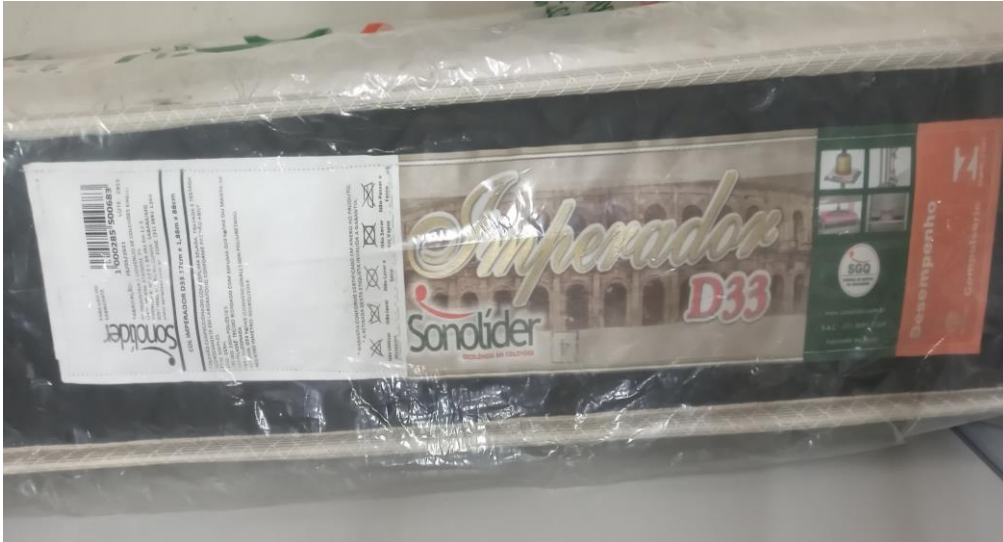
FOTO 3: LOCAL DE FIXAÇÃO DA ETIQUETA NA AMOSTRA RECEBIDA PARA ENSAIO

Laboratório de Ensaio Acreditado pela Cgcre de acordo com a ABNT NBR ISO/IEC 17025, sob o nº CRL-1307 A Cgcre é signatária do Acordo de Reconhecimento Mútuo da ILAC – International Laboratory Accreditation Cooperation