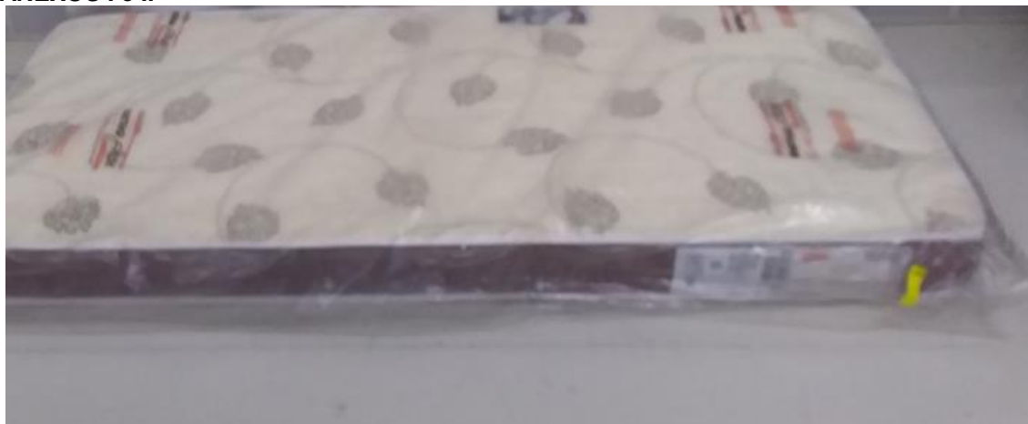
FOTO 3: LOCAL DE FIXAÇÃO DA ETIQUETA NA AMOSTRA RECEBIDA PARA ENSAIO