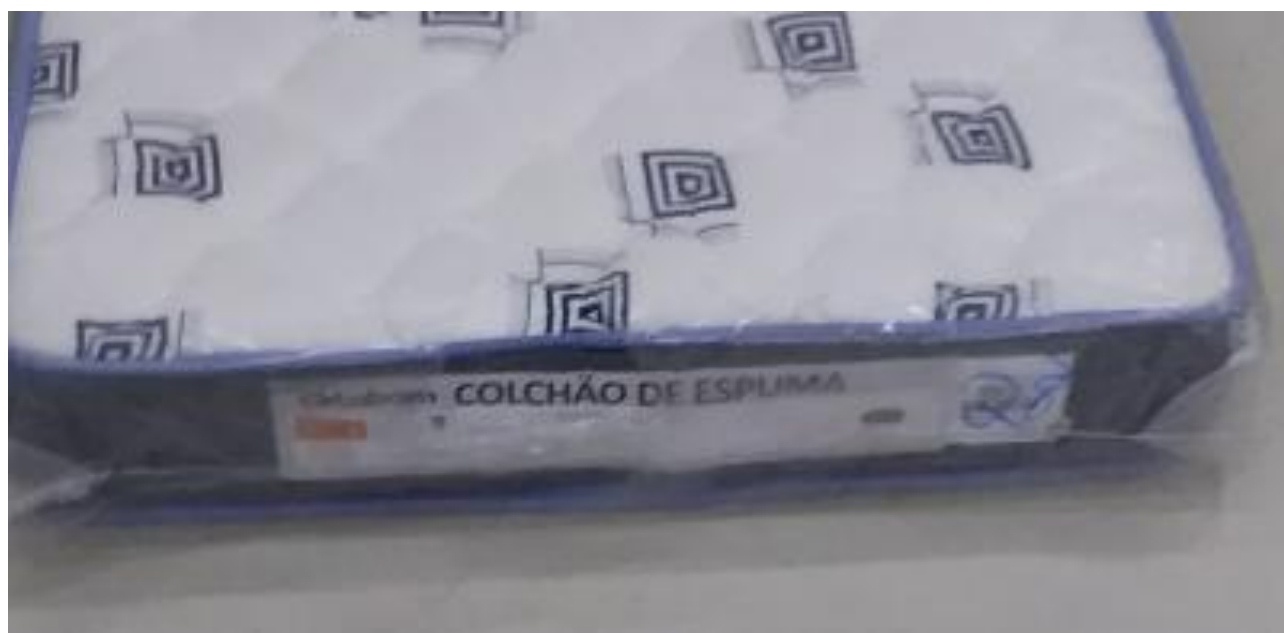
FOTO 3: LOCAL DE FIXAÇÃO DA ETIQUETA NA AMOSTRA RECEBIDA PARA ENSAIO

Os resultados apresentados no presente documento referem-se exclusivamente a(s) amostra(s) ensaiada(s). A reprodução deste documento somente poderá ser feita na íntegra e sua utilização para fins promocionais depende de autorização prévia.