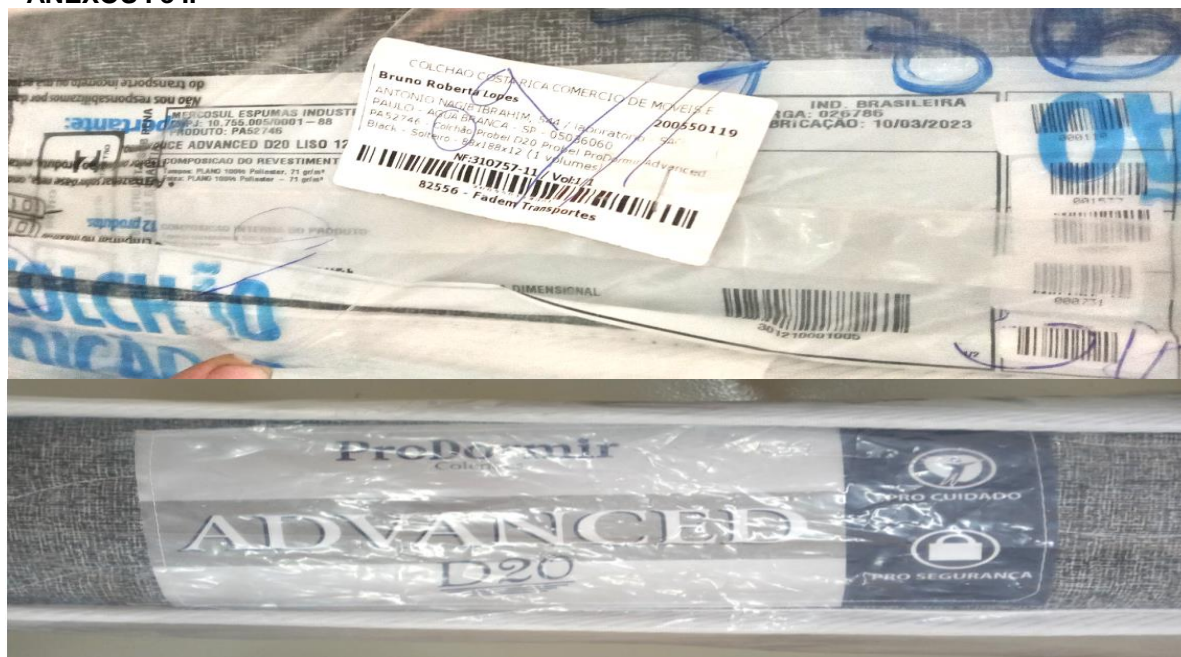
FOTO 3: LOCAL DE FIXAÇÃO DA ETIQUETA NA AMOSTRA RECEBIDA PARA ENSAIO

Os resultados apresentados no presente documento referem-se exclusivamente a(s) amostra(s) ensaiada(s). A reprodução deste documento somente poderá ser feita na íntegra e sua utilização para fins promocionais depende de autorização prévia.