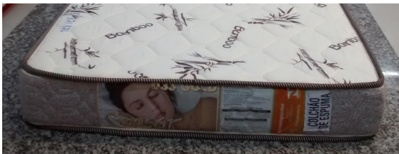
FOTO 3: LOCAL DE FIXAÇÃO DA ETIQUETA NA AMOSTRA RECEBIDA PARA ENSAIO