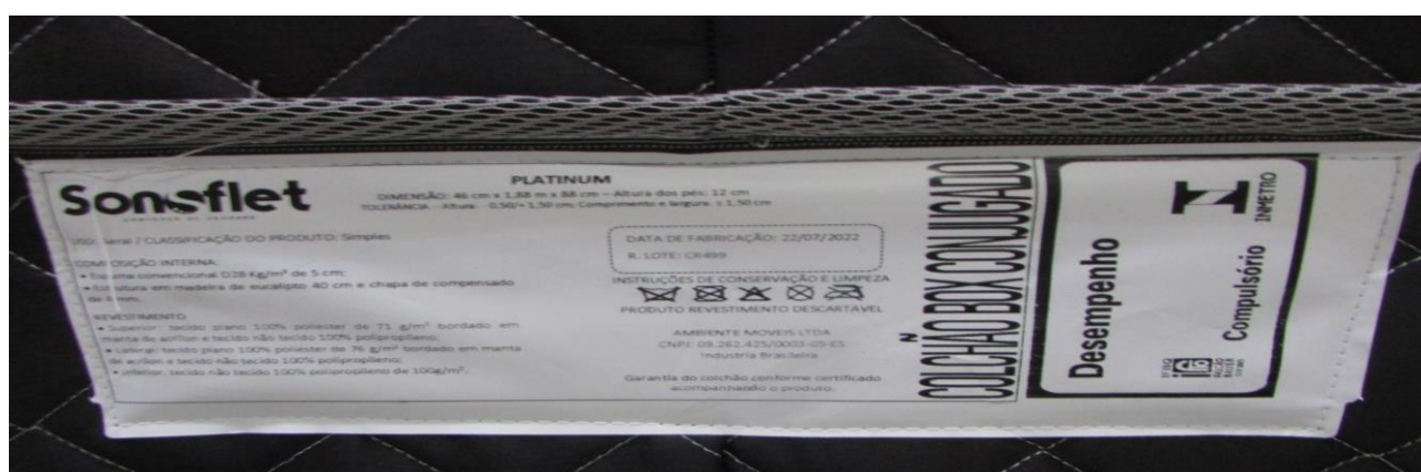
FOTO 3: LOCAL DE FIXAÇÃO DA ETIQUETA NA AMOSTRA RECEBIDA PARA ENSAIO