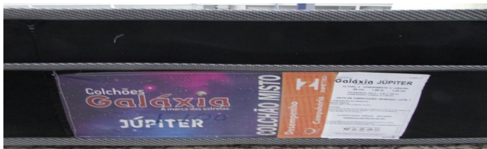
FOTO 3: LOCAL DE FIXAÇÃO DA ETIQUETA NA AMOSTRA RECEBIDA PARA ENSAIO

Os resultados apresentados no presente documento referem-se exclusivamente a(s) amostra(s) ensaiada(s). A reprodução deste documento somente poderá ser feita na íntegra e sua utilização para fins promocionais depende de autorização prévia.